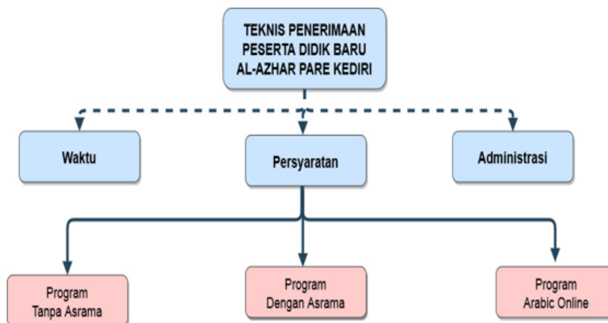
Gambar 2 Teknis Penerimaan Peserta Didik Baru Al-Azhar Pare Kediri